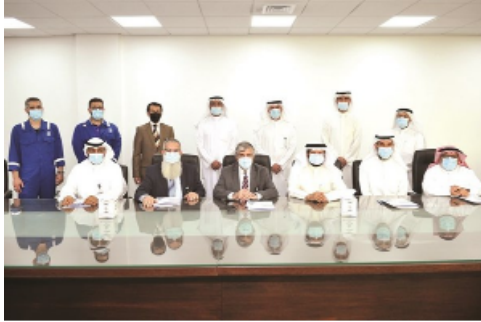
لقطة تذكارية على هامش توقيع مذكرة التفاهم المشترك بين التطبيقي ونפט الكويت

وبهدف هذا المشروع الى تزويد الطلبة والمتدربين بالجوانب العملية الميدانية، بالإضافة إلى الجوانب الأكاديمية التي يتلقاها الطالب بالكلية أثناء فترة الدراسة مما يسهم إيجاباً بإعداد قوى وطنية عاملة على درجة من الكفاءة والمسؤولية.