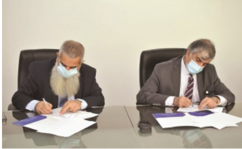
جانب من توقيع مذكرة التفاهم بين التطبيقي ونפט الكويت

وقعت الهيئة العامة للتعليم التطبيقي والتدريب مذكرة تفاهم مشترك مع شركة نفط الكويت «KOC» وتنص المذكرة على استقطاب وتجهيز وتشغيل معمل متكامل للآلات الدقيقة في كلية الدراسات التكنولوجية من قبل شركة نفط الكويت على أن يتم البدء والعمل بها خلال الفترة القادمة.